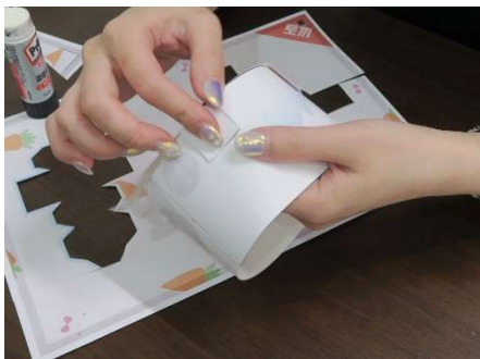
丸パーツ4ヶ所折り曲げ のりづけし、ボディの絵柄に 合わせて貼り付けます