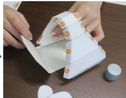
オレンジの数字入りパーツを 立体的に折り曲げ、のりづけ