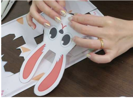
顔部分を貼り付けます