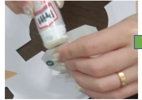
緑の数字にのりづけ、立方体になるよう貼り合わせ