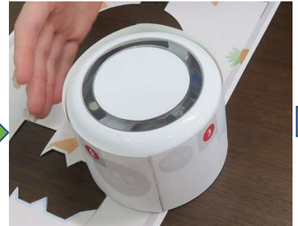
かみぼつとに合わせながら 貼り合わせます