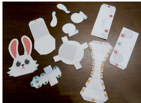
※ウサギパーツは11個