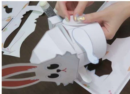
手・足部分も貼り付けて