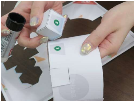
緑⑧にのりづけ、しっぽとボディを貼り付けます