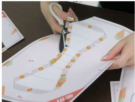
線に沿って切り取ります