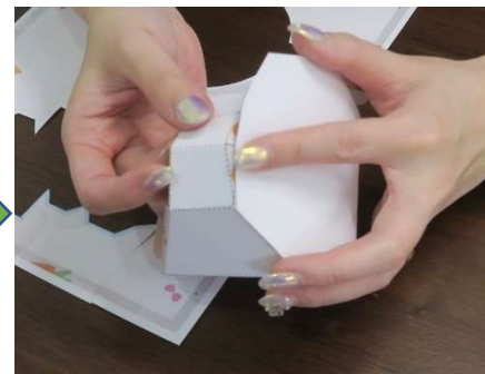
多角形パーツの角度に合わせ 張り合わせます