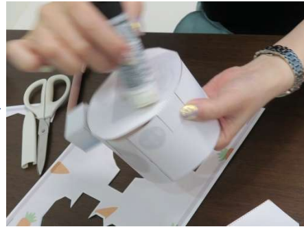
ボディと顔部分を貼り合わせます