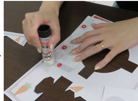
赤の①・②にのりづけし、