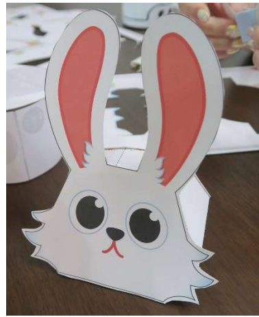
立体的な顔部分完成！