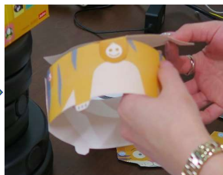
顔の位置を合わせて貼り付け