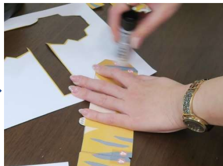
ピンク①にのりづけ