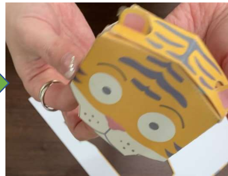
顔パーツの仕上がり↑