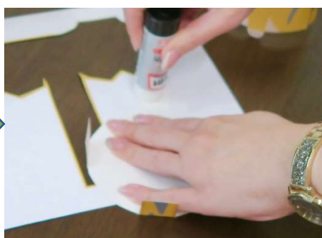
裏面にのりづけします