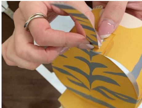
しっぽもボディに貼り付け