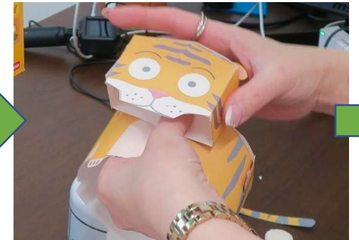
顔部分をボディに貼り付け