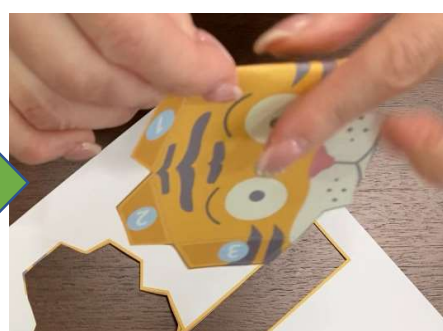
顔パーツを立体的に折り曲げます