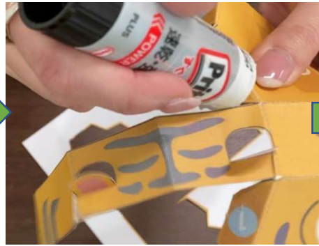
顔部分をのりづけし 貼り合わせます