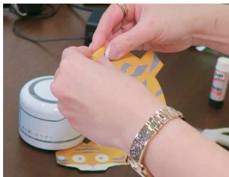
丸パーツ 4ヶ所を折り曲げ