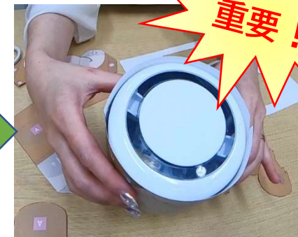
かみぼつに合わせながら 貼り付けます