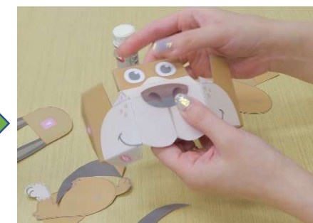
顔パーツを線に合わせて 折っていきます