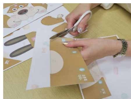
線に沿って切り取ります