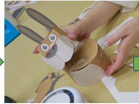
顔パーツと胴体パーツを 貼り付けます