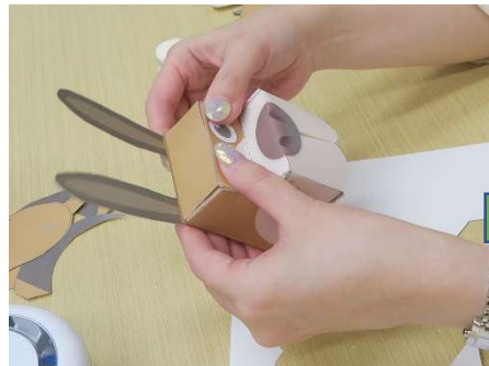
顔パーツできました！