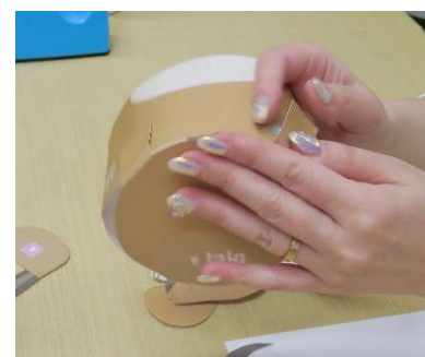
絵柄に合わせて貼り付けます