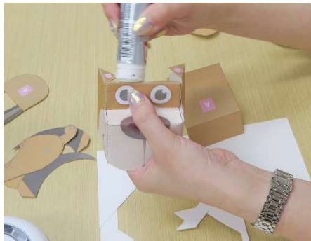
顔を立体的にのりづけ