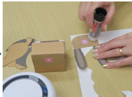
ピンク A をのりづけし、 顔パーツに耳を貼り付けます