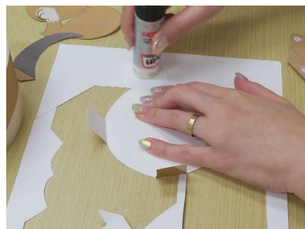
裏面にのりづけします