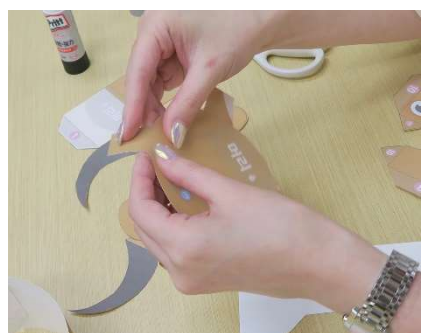
丸パーツ 4ヶ所を折り曲げ