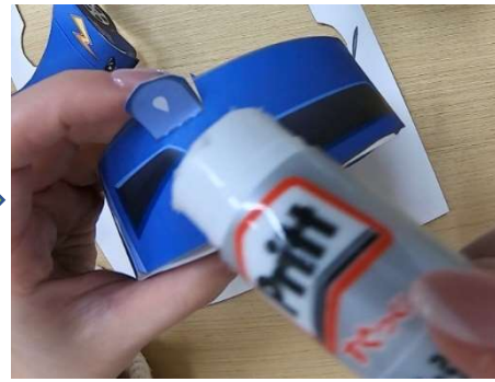
最初に切り込みを入れた△マーク にのりづけします