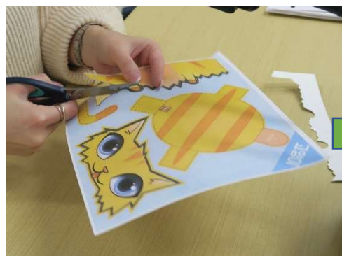
線に沿って切り取ります