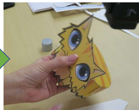
“head”にねこの顔を貼り付けます