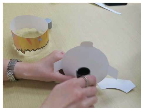
丸パーツの4か所折り曲げ、内側にのりづけ