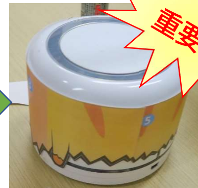
のりが乾く前にかみぼつとで調整