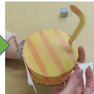
“tail”にねこのしっぽを貼り付けます